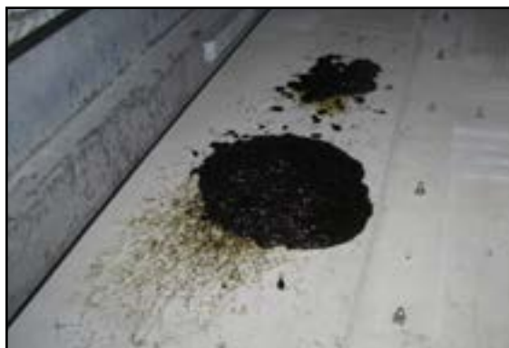
Lækfedt der ikke opsamles.