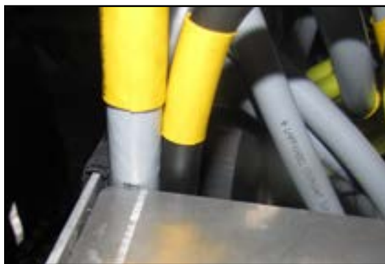
Kabler der slides på skarpe kanter.