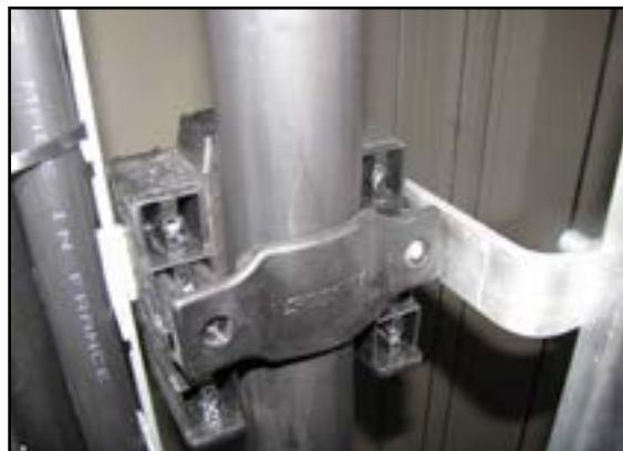
Manglende fastgørelse af kabel i tårn.