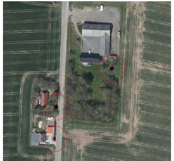
Beregningspunkterne afsættes på baggrund af granskning af luftfoto.

Inden en vindmølle kan sættes i drift, skal kommunen godkende indgivet dokumentation for at støjen fra vindmøllen forventes at ligge under de gældende danske støjgrænser.